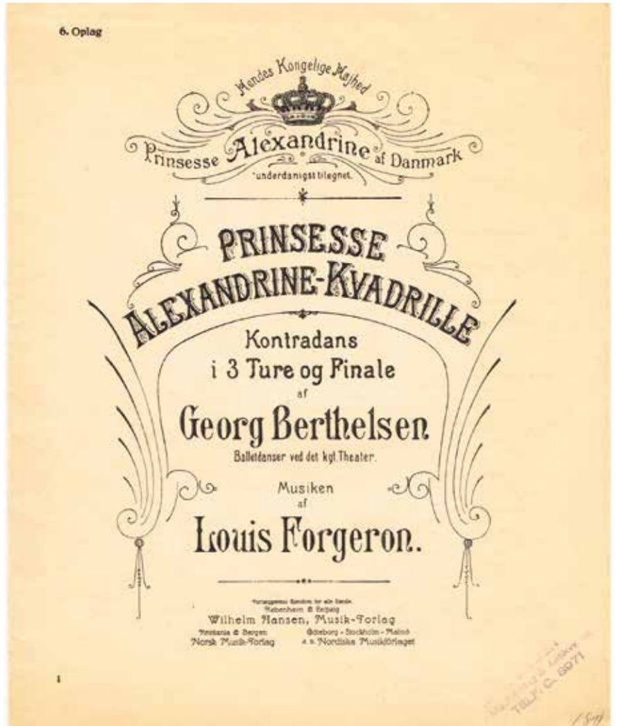
Forside af nodetrykket fra 1902.